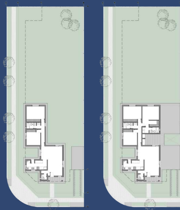
1 Planta Baja Posicionamiento en el Lote