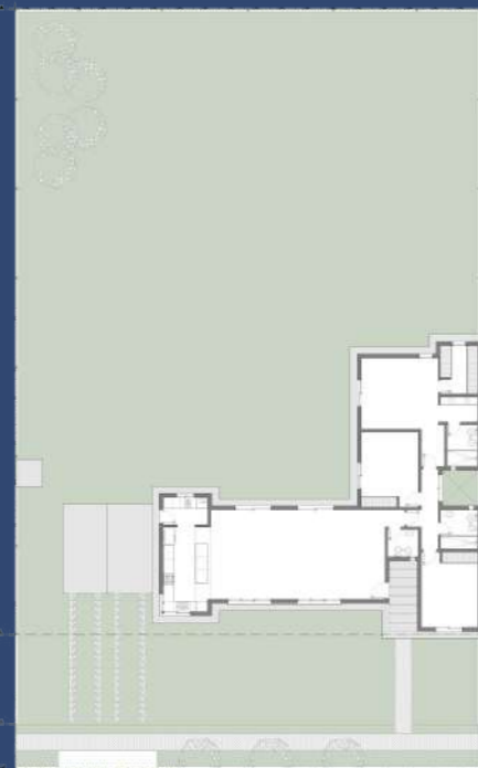
1 Planta Baja Posicionamiento en el Lote