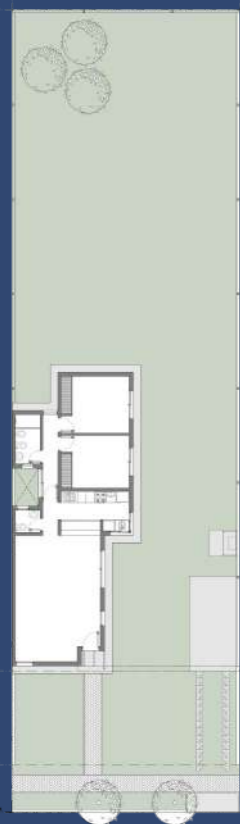
1 Planta Baja Posicionamiento en el Lote