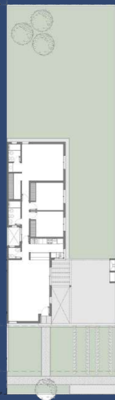
2 Planta Baja Segunda Etapa