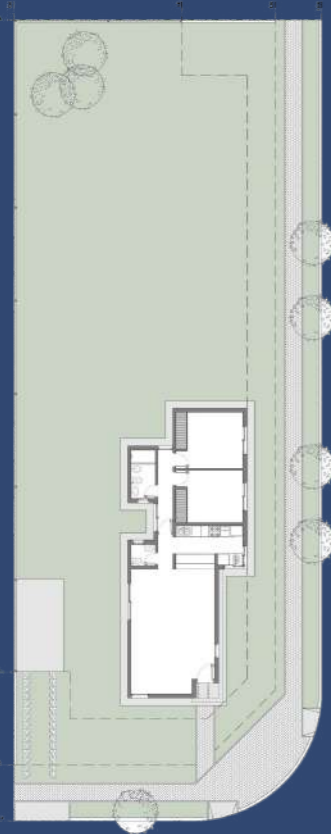
1 Planta Baja Posicionamiento en el Lote