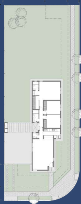
2 Planta Baja Segunda Etapa