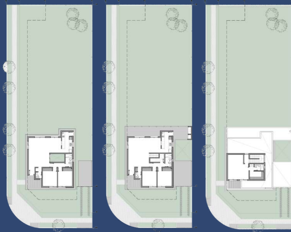
1 Planta Baja Posicionamiento en el Lote