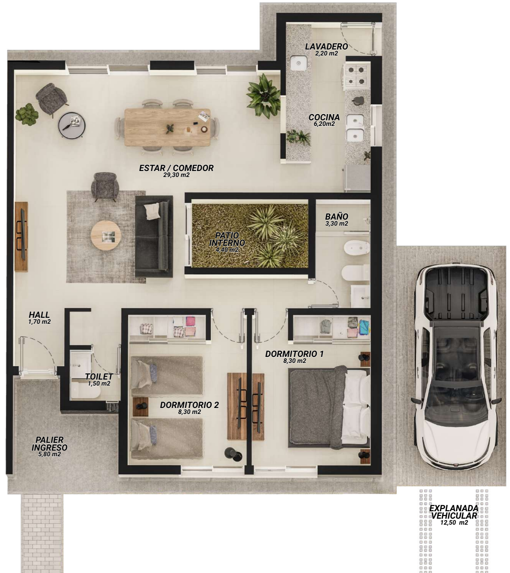
EXPLANADA VEHICULAR 12,50 m²