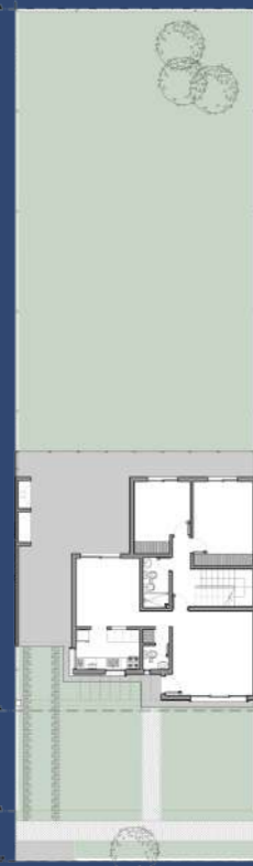
2 Planta Baja Segunda Etapa