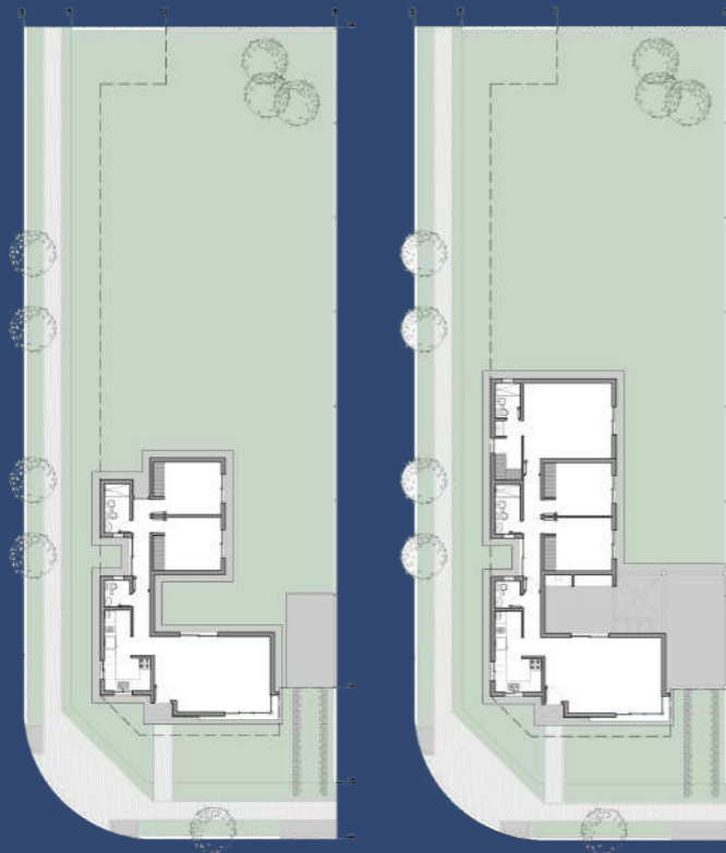
1 Planta Baja Posicionamiento en el Lote