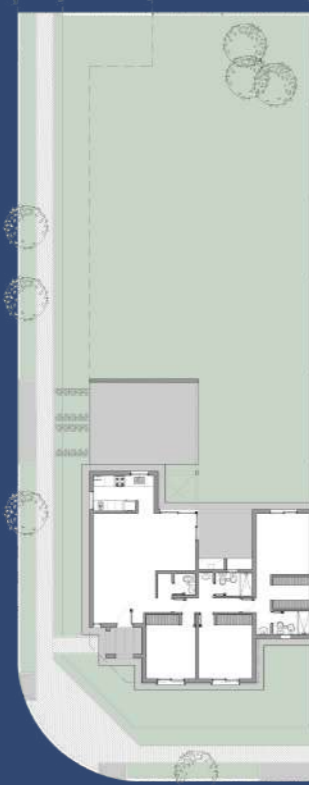
2 Planta Baja Segunda Etapa