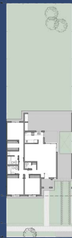
2 Planta Baja Segunda Etapa